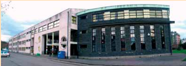
I.E.S. GALILEO GALILEI. NAVIA