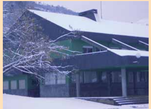
C.P. VEGA DE GUCEO