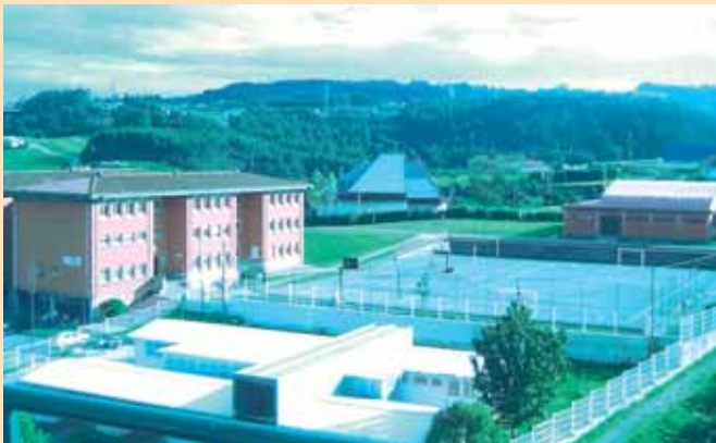
C.P. LOS CAMPOS CORVERA DE ASTURIAS