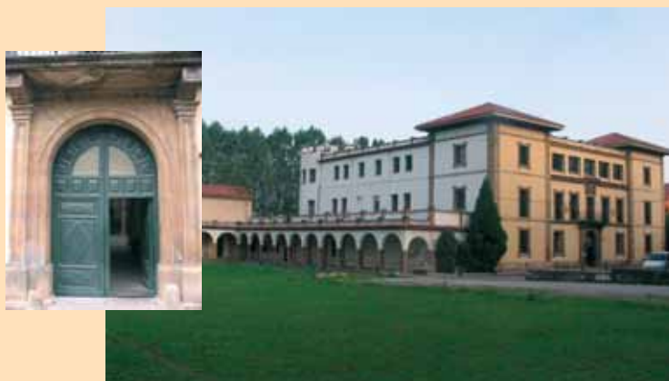
I.E.S. BERNALDO DE QUIROS MIERES