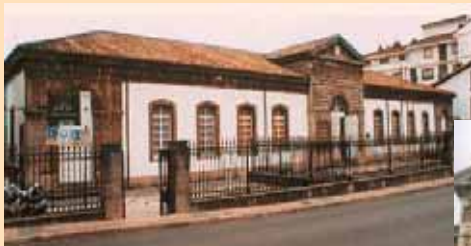
I.E.S. CRISTO SOCORRO LUANCO